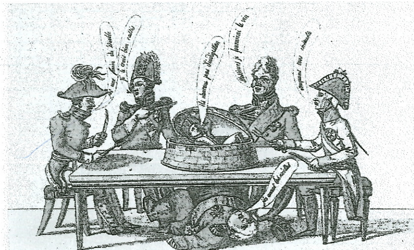
2 « Le pâté indigeste. » Les vainqueurs (Angleterre, Prusse, Russie et Autriche) se partagent un pâté contenant Napoléon, tandis que Louis XVIII sous la table dit : « J'en aurais les miettes. » B.N.F., Paris.

Étude de deux documents : doc2 page 111: carte de l'Europe à l'issue du Congrès de Vienne et doc 2 ci-dessous